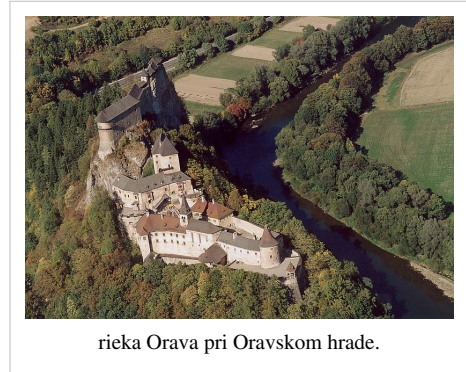
rieka Orava pri Oravskom hrade.

Najväčší prietok má rieka v marci a apríli, keď sa topí sneh, najmenší v januári a februári. Historicky najnižší prietok zaznamenali ešte pred vybudovaním priehrady – 4,8 m 3 /s, najväčší už po vybudovaní priehrady 19. júna 1958 – 2300 m 3 /s.