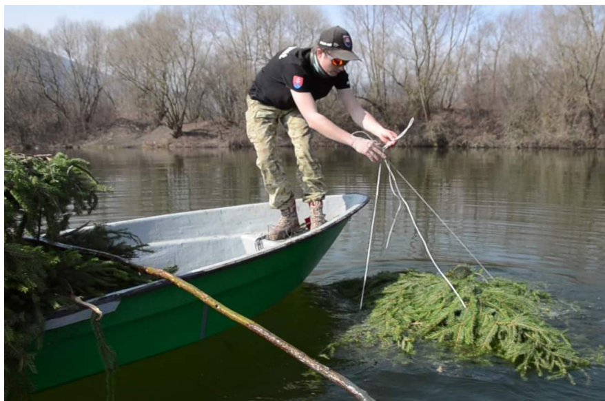
Výroba a osadenie zubáčových hniezd do Párnických jazier